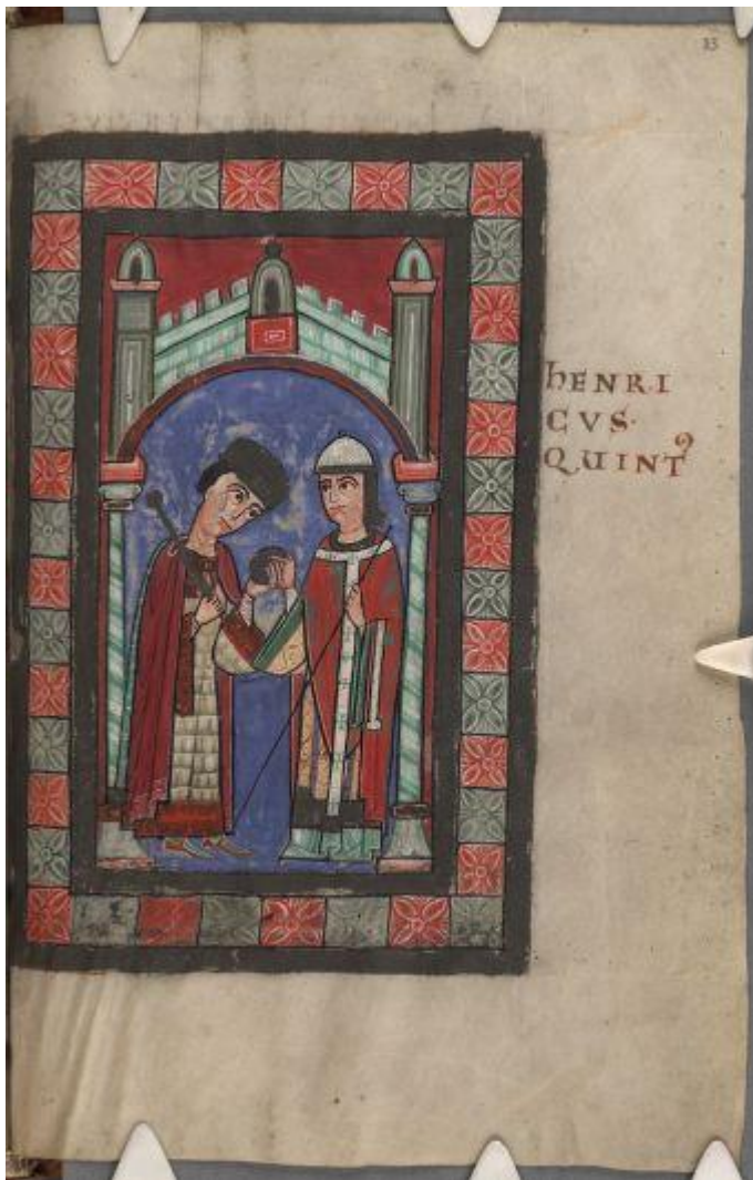
Abbildung 2: Erzbischof Ruthard von Mainz überreicht Heinrich V. die Sphaira. Darstellung in der Anonymen Kaiserchronik (1112/1114); Cambridge, Corpus Christi College, The Parker Library, CCCC Ms 373, f. 83r. [ Link 1 ] [ Link 2 ]

Beschreibung der Vorgänge in den Quellen, in denen diese bildliche Darstellungen enthalten sind (Edition mit Übersetzung):